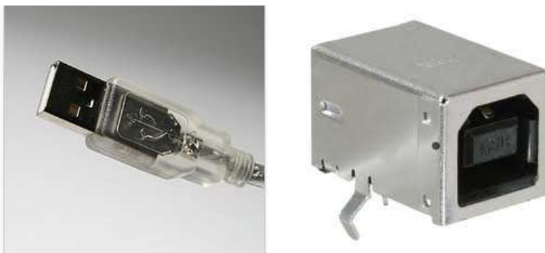
Figura 1 – Fichas USB do tipo A e do tipo B (da esquerda para a direita, respectivamente).

Tipicamente os modems ADSL utilizados pela Ar Telecom têm interfaces USB V2.0 em que a principal vantagem reside no aumento do débito binário que vai até 480Mbps para ligações half duplex.